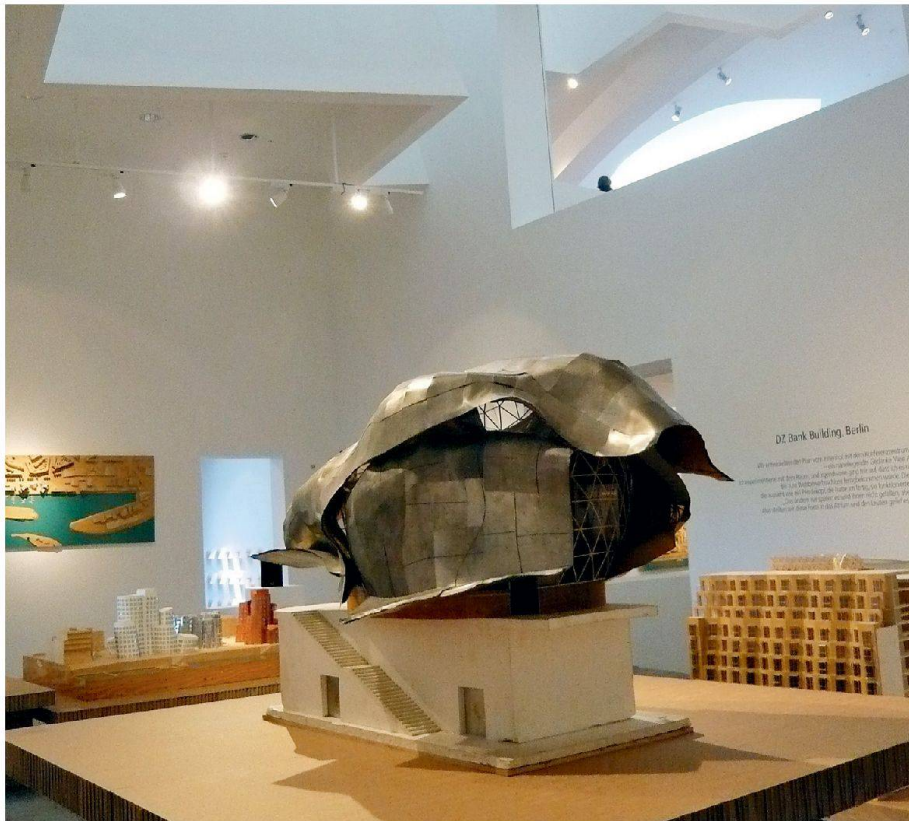
01 Modell des Konferenzentrums in der DZ-Bank Berlin

Als 1989 mit dem Vitra Design Museum in Weil am Rhein (D) das erste von Frank O. Gehry in Europa realisierte Gebäude eröffnet wurde, staunten Publikum und Fachleute. Darf man derart freie Volumen als Museum bezeichnen? Man darf, wenn man Frank O. Gehry heisst. Denn auch heute noch stimmt dort alles: Der Bau mit seinem menschlichen Massstab ist trotz seiner ungewöhnlichen Form vollauf nutzbar. Derzeit ist hier eine Auswahl von Gehrys Projekten der letzten dreizehn Jahre zu sehen.