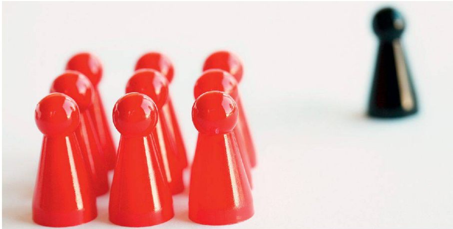
01 Mobbing am Arbeitsplatz: Schaden für Opfer und Arbeitgeber

Mobbing, Bossing, Cyberbullying und Co.: Die einschlägige Forschung identifiziert immer weitere psychosoziale Belastungen. Mit einer neuen Website soll wissenschaftlich fundiert und fortlaufend über diese Erkenntnisse informiert werden.