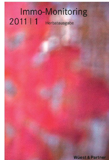
01 Cover Immo-Monitoring 2011/1

lung in sämtlichen Immobilienmarktsegmenten. Ein weiterer Abschnitt zeigt die Nachfragetrends im Wohnungsmarkt: Die Resultate stammen aus der zweijährlichen Immo-Barometer-Umfrage. Rund 1600 Haushalte aus der deutsch- und der französischsprachigen Schweiz wurden zu ihrer aktuellen Wohnsituation und allfälligen Veränderungsabsichten befragt. Die Kapitel 5 und 6 sind weiteren Thesen gewidmet, darunter die Auswirkungen von Gemeindefusionen auf Standortfaktoren oder der Zuzug internationaler Unternehmen. Zudem wird die Vielzahl der Nachhaltigkeitslabels thematisiert. Ein Vergleich stellt die Wichtigsten vor, wobei die Minergie-Zertifizierungen in einem eigenen Kapitel behandelt werden. Ein Immobilienatlas und diverse Markt- und Regionendaten sind ebenfalls enthalten. Das Nachschlagewerk bietet zudem einen Überblick über Trends im Wohn- und übrigen Hochbau mit Themen wie Tragkonstruktion, Fassaden oder Dachkonstruktion.