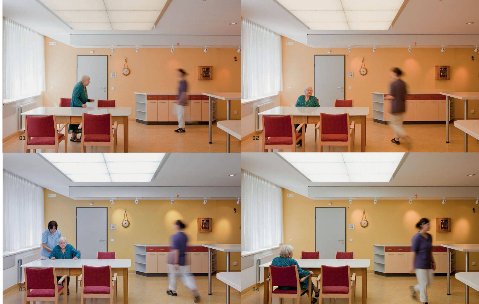
01–04 Das Alten- und Pflegeheim St. Katharina in Wien wurde von Grund auf renoviert. Im 1. Stock wurde eine Wohngruppe eingerichtet, in der 15 an Demenz erkrankte Bewohner leben. Die unterstützende Wirkung von Licht wird dort wissenschaftlich untersucht. In der dynamischen Situation wurden die Beleuchtungsstärken von 300 lx am Morgen auf circa 1200 lx zum Mittag angehoben und bis 18 Uhr wieder abgesenkt. Dabei änderte sich die Farbtemperatur von 3000 K auf 8000 K und wieder auf 3000 K

maximal 3000 lx) als auch die Farbtemperatur (zwischen 3000 und 8000 K) verändern. Am Abend werden die Wände mit Strahlern beleuchtet, die Lichtdecke ist ausgeschaltet. Die zweite Versuchsreihe wurde in einem Altersheim der Caritas Socialis in Wien durchgeführt. Auch hier erhellen grossflächige Leuchten die Aufenthalts- und Gangbereiche der Demenzstation. Die Lichtsituation kann gewählt werden, vom statisch gleichen bis zum dynamisch veränderlichen Licht. In einem Fall verändert sich das Licht über den Tag: Es beginnt am Morgen mit wärmeren (leicht gelblichen) Farbtönen zu leuchten, steigert sich dann in helles blauweisses Licht und geht am Nachmittag wieder auf geringere Helligkeit im warmweissen Ton zurück. Beide Beleuchtungsanlagen wurden im Rahmen einer Gebäudesanierung installiert.