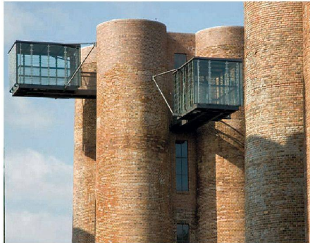
02 Ehemals Teil der Braunkohlegrosskokerei, heute touristische Attraktion