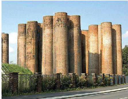
01 Die Biotürme in Lauchhammer erinnern an das Castel del Monte in Italien