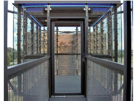
03 Der Anbau der Aussichtskanzeln wurde im Rahmen der IBA Fürst-Pückler-Land realisiert

Die Biotürme erinnern als einzige Bauten an die Braunkohlegrosskokerei im sächsischen Lauchhammer. Sie sind ein Projekt der Internationalen Bauausstellung (IBA) Fürst-Pückler-Land 2010.