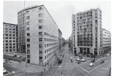
03 Die beiden Palazzi Montecatini in Mailand (erbaut 1936 und 1952) an der Kreuzung Via della Moscova und Via Filippo Turati und am Largo Guido Donegani

Vom Besteck bis zum Hochhaus – Gio Ponti hat umfassend und nahezu grenzenlos gewirkt. Das Lebenswerk des 1979 im Alter von knapp 88 Jahren verstorbenen Architekten, Designers und Publizisten in einer Ausstellung zu fassen, erscheint als fast unmögliches Unterfangen. Der Kurator Germano Celant hat dies in der Triennale di Milano gewagt.