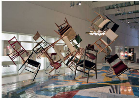
01 Herzstück der Ausstellung ist eine Installation des Majolika-Bodens für den Empfangsraum der «Salzburger Nachrichten» (1976). Darüber aufgehängt sind von Gio Ponti entworfene Stühle