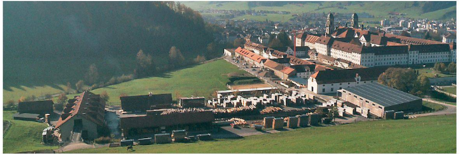
01 Kloster Einsiedeln mit Holzhof

Zum 25-Jahr-Jubiläum stand der Preis unter dem Thema «Waldeigentum als Verpflichtung» und wurde dem Kloster Einsiedeln verliehen. Dabei mag eine Rolle gespielt haben, dass das Kloster den ihm anvertrauten Wald seit über 1000 Jahren bewirtschaftet. Zu Beginn des 19. Jahrhunderts waren die klösterlichen Waldungen übernutzt, und es entstand ein neues Bewusstsein für eine nachhaltige Nutzung des Waldes. So veranlasste der Vorsteher des klösterlichen Forstbetriebes 1831 eine Bestandesaufnahme aller Wälder und erliess Anweisungen zur Schonung des Jungwaldes. Auch legte er fest, wo und wie Holz geschlagen werden durfte. Bereits 1885 wurde ein Wirtschaftsplan für die Klosterwaldungen ausgearbeitet. Mit Unterstützung des kantonalen Forstdienstes konnte der Zustand der Wälder seither stetig verbessert werden.