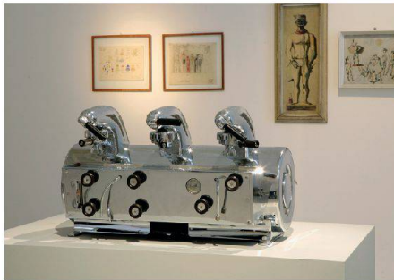
02 Die Kaffeemaschine «La Cornuta», 1949 für die Firma Pavoni entworfen