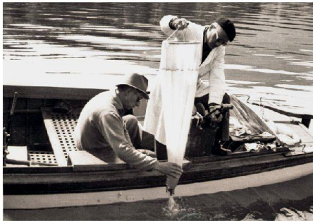
01 Planktonprobenahme im Vierwaldstättersee, 1940

Die Eawag, das Wasserforschungsinstitut der ETH, feiert dieses Jahr ihr 75-Jahr-Jubiläum. Der Infotag am 22. Juni diente einerseits einem Rückblick auf die wichtigsten Entwicklungen der letzten Jahrzehnte in der Trinkwasserversorgung, der Abwasserreinigung und im Gewässerschutz. Zum anderen wurden aktuelle Forschungsprojekte vorgestellt, mit denen Lösungen für die künftigen Herausforderungen entwickelt werden. 1