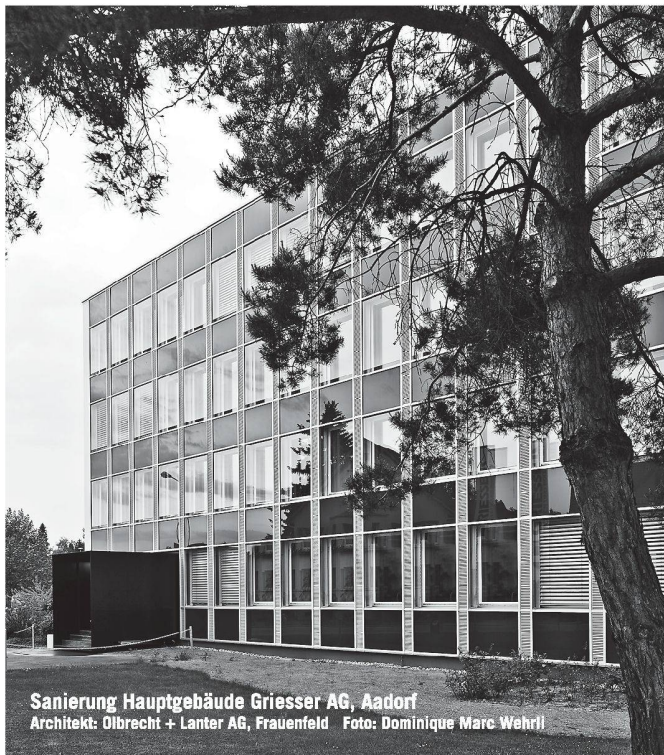
Sanierung Hauptgebäude Griesser AG, Aadorf

Architekt: Olbrecht + Lanter AG, Frauenfeld