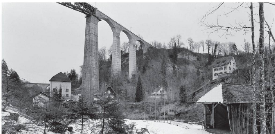
01 Sitterviadukt der Südostbahn, 1910, von Rudolf Weber und Alexander Acatos (Ingenieure), Fritz Ackermann (Stahlbau) und Richard Coray (Gerüstbau). Vorne rechts: Kubelbrücke, 1780, eine der letzten erhaltenen Brücken von Hans Ulrich Grubenmann

Die Ausstellung «Landschaft und Kunstbauten» ist zurzeit im Schweizerischen Architekturmuseum zu sehen. Jürg Conzett's «persönliches Inventar» für die Architekturbiennale Venedig 2010, fotografiert von Martin Linsi, thematisiert die Tradition der Ingenieurbaukunst (TEC21 41/2010). Im Gespräch erläutert Conzett, was ihn daran fasziniert.