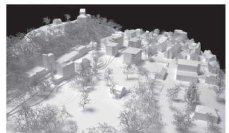
05 Ganz Landschaftsarchitekten