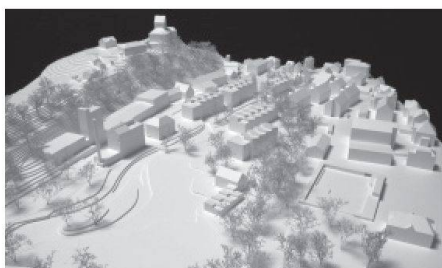
04 Mettler Landschaftsarchitektur