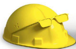
Planung & Ausführung