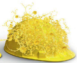
Nachhaltigkeit & Innovation

Auf die Erstellung hochkomplexer Klinker- und Sichtsteinfassaden haben wir unser Fundament gebaut. Dass wir visionär denken und entsprechend planen und realisieren, beweisen wir täglich in sämtlichen Bereichen unserer Geschäftsfelder. Wir schaffen Mehrwert, mit System am Bau: www.keller-ziegeleien.ch