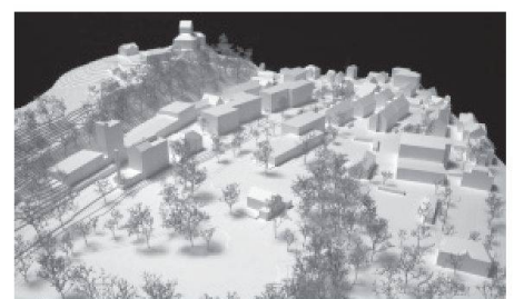
07 Schweingruber Zulauf Landschaftsarchitekten