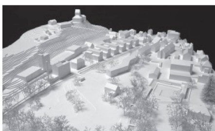
06 raderschallpartner Landschaftsarchitekten