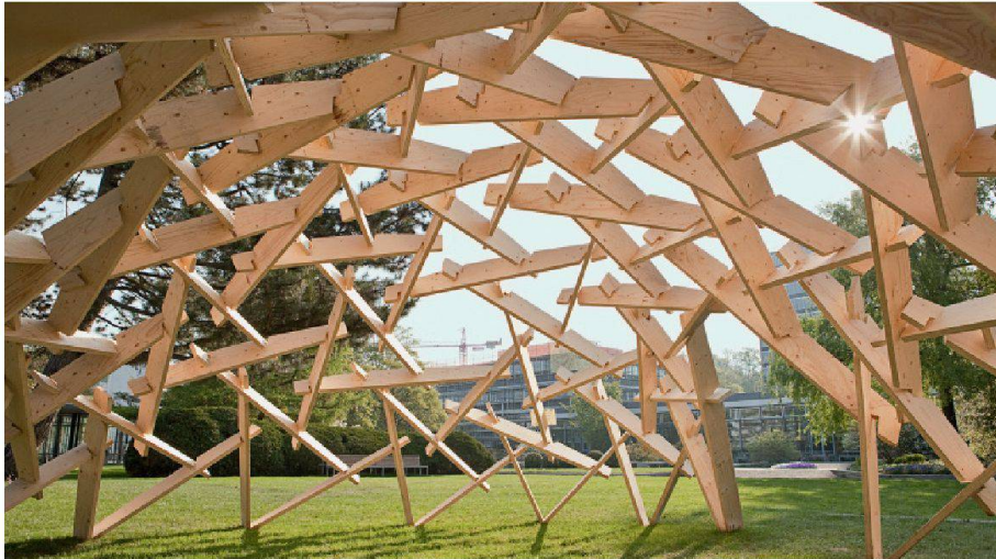
01 Pergola ETH Science City. Die Lage der Balken wird über Schraubverbindungen gesichert. Diese wirken hauptsächlich in den stark geneigten Balken, dort, wo die Reibung zwischen den Elementen nachlässt

Das Departement Architektur der ETH Zürich forscht an Techniken für Konstruktionen mit kurzen Holzelementen. Damit lassen sich Holzstücke mit geringen Längen bzw. Holzverschnitt für weit gespannte Tragwerke einsetzen, und es kann lokales Holz verwendet werden.