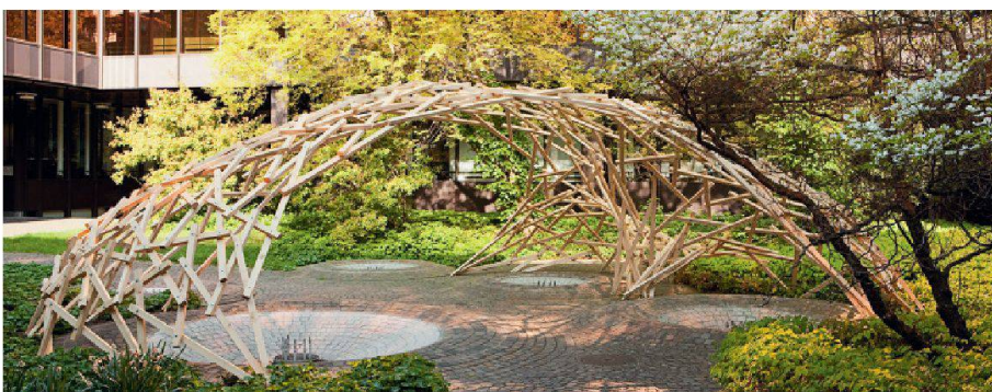
02 Tragwerk im Hof der ETH-Architekturfakultät