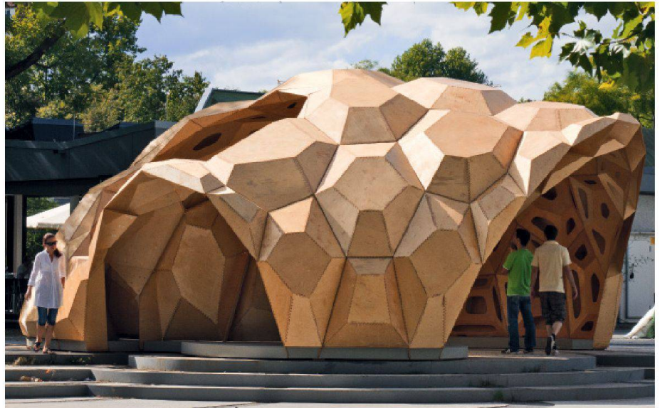
01 Die Struktur des Pavillons entspricht den mechanischen Beanspruchungen. Im Zentrum mit kleiner Krümmung sind die Kassetten über 2 m gross, während sie zum Rand hin teilweise nur 0.5 m gross sind

Für den Entwurf spielte die Morphologie des Plattenskeletts des «Sanddollars» eine wichtige Rolle: Die biegetragfähige und verformbare Struktur entsteht, wenn immer nur drei Platten an einem Punkt aufeinanderstossen. Mit diesen Vorgaben entwickelten Studierende und Wissenschaftler einen zweistufigen hierarchischen Aufbau. Die einzelnen Kassetten sind mit biegeweichen Keilzinkenstö-