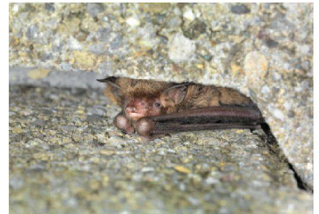
02 Wasserfledermäuse fliegen immer auf denselben Flugstrassen von ihren Verstecken, hier einer Brückenspalte, ins Jagdgebiet. Sie sind vom Mittelland bis ins Gebirge weit verbreitet