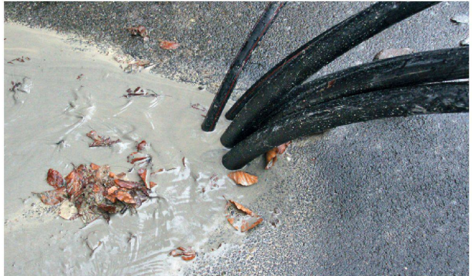
01 Die Wahl eines thermisch besser leitfähigen Hinterfüllmaterials ist eine einfache Massnahme, um die Effizienz einer Erdwärmesonde zu verbessern

Um diese Aufgaben zu erfüllen, muss das Hinterfüllmaterial gut wärmeleitend und frostsicher sein sowie nicht durch Erosion abbaubar. In der Schweiz werden heute aber überwiegend Hinterfüllmörtel angewendet, die diesen Forderungen nicht entsprechen. Dazu