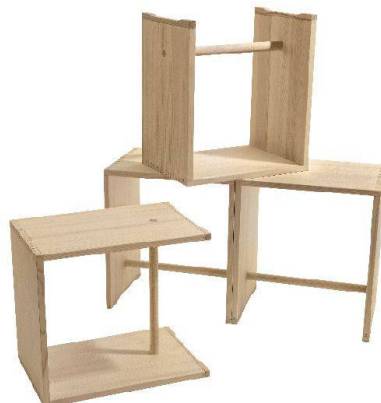
04 Der Klassiker: Ulmer Hocker, 1954