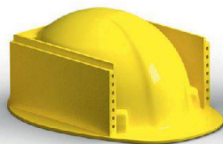
Fassaden & Boden