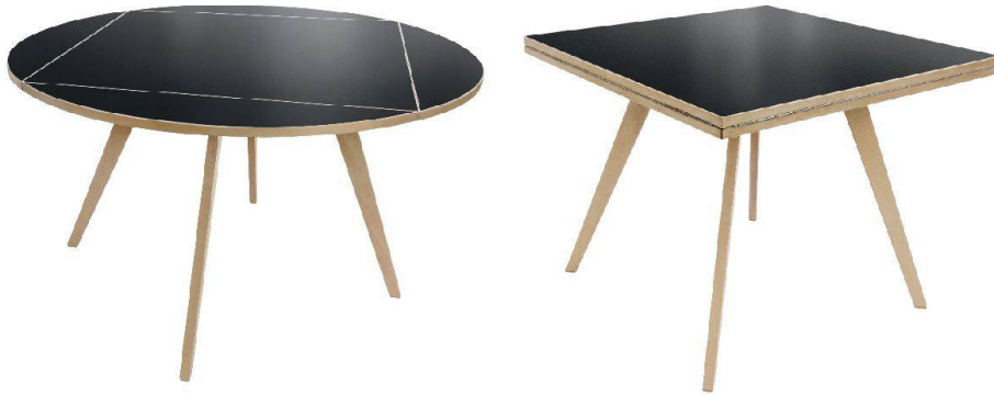
01–02 Quadratrundtisch von 1949, einmal aufgeklappt als Rundtisch, einmal als Quadrattisch

Möbel von Max Bill (1908–1994) wurden nur kurze Zeit hergestellt. Eine prominente Ausnahme ist der Ulmer Hocker: 1954 für die Ulmer Hochschule für Gestaltung entworfen, ist er heute eine Designikone. Der Quadratrundtisch hingegen dürfte nur Bill-Fans ein Begriff sein. Sein Bekanntheitsgrad könnte aber bald wachsen: Der Möbelhersteller und -händler Wohnbedarf produzierte anlässlich seines 80-Jahr-Jubiläums eine Re-Edition von Max-Bill-Möbeln.