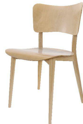
05 Kreuzzargenstuhl, 1951