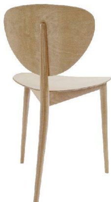
03 Dreibeinestuhl, 1949

Weitere Informationen: www.wohnbedarf.ch , www.bill-stiftung.ch