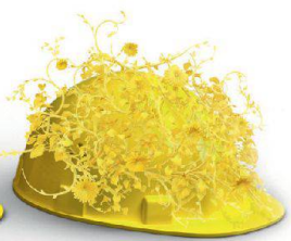
Nachhaltigkeit & Innovation

Auf die Erstellung hochkomplexer Klinker- und Sichtsteinfassaden haben wir unser Fundament gebaut. Dass wir visionär denken und entsprechend planen und realisieren, beweisen wir täglich in sämtlichen Bereichen unserer Geschäftsfelder. Wir schaffen Mehrwert, mit System am Bau: www.keller-ziegeleien.ch