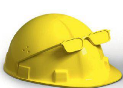
Planung & Ausführung