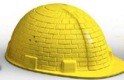
Mauerwerk & Bauteile