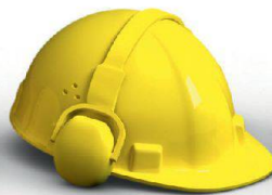
Innenausbau & Akustik