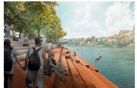
06 «Pegelnul» (Andreas Geser)

dennoch auf die unterschiedlichen Orte und sich ändernde Bedingungen flexibel reagieren kann.