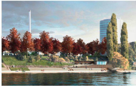
02 «Vierklang»