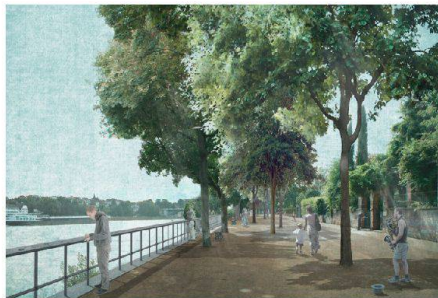
05 «Confluo»