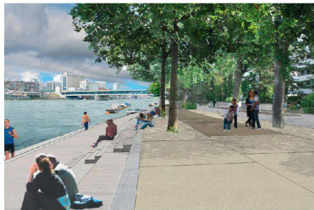
03 «PANTA RHEIn»