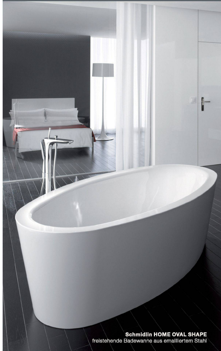
Schmidlin HOME OVAL SHAPE freistehende Badewanne aus emailliertem Stahl

Wir visualisieren Ihre Projekte: Mathys Partner - Technopark Zürich - 044 445 17 55 - kontakt@visualisierung.ch