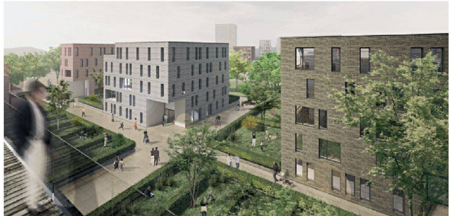
02 Siegerprojekt Städtebau (KCAP/Schweingruber Zulauf)

Im Bereich Städtebau empfahl die Jury das Projekt des Teams um Kees Christiaanse zur Weiterbearbeitung. Der Entwurf überzeugte durch seine Zentralität, offene Stadträume und das Netz von öffentlichen und privaten Räumen. Die Planer entwarfen eine übersichtliche neue urbane Achse, die an der in-stand gesetzten und erweiterten alten Aeschbachhalle in einen Park führt. Überhohe Geschosse ermöglichen künftige Nutzungsänderungen in den Erdgeschoss. Durch die Massstäblichkeit der Körper und der Aussenräume verzahnt sich das neue Quartier mit dem Bestand. Wenig ikonografisch entwickelten die Planer das Hochhaus als streng rechteckige Form. Für dieses Element an der spitzwinkligen Strassenkreuzung wählte die Jury den Entwurf von Schneider & Schneider Architekten aus. Ihr Turm nimmt durch seine unregelmässig sechseckige Form verschiedene Raumbezüge auf und wirkt durch die gekanteten Fassaden sehr schlank, was insgesamt einen prägnanten Quartiersauftakt erzeugt. In der Weiterbearbeitung müssen die Planer nun den polygonalen Turm und den rechteckigen Städtebau vereinen.