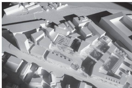
03 Schneider & Schneider Architekten

(af/cc) Das Areal «Torfeld Süd» an der Grenze zwischen Aarau und Buchs – heute noch hauptsächlich von der Rockwell Automation genutzt – soll in ein multifunktionales Quartier mit Wohnen und Arbeiten sowie einem Fussballstadion umgewandelt werden. Als Eigentümerin des mit 50000 m 2 grössten Anteils veranstaltete die Mobimo einen Studienauftrag mit acht Teams für ihre vier Baufelder. Die Investorin beabsichtigt, das Quartier nach dem Standard der Deutschen Gesellschaft für Nachhaltiges Bauen (DGNB) zu zertifizieren (vgl. Kasten). Entsprechende Kriterien wurden in den Studienauftrag einbezogen und durch einen Experten geprüft. Ausserdem soll die historische Aeschbachhalle im Zentrum des Areals als Industriedenkmal erhalten und für die Öffentlichkeit umgenutzt werden.