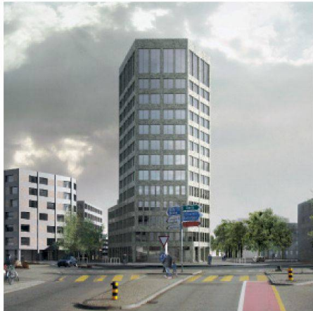
01 Siegerprojekt Hochhaus (Schneider & Schneider Architekten)

Das Areal «Torfeld Süd» in Aarau soll in eine dichte urbane Mischung aus Wohnen, Arbeiten und Freizeit verwandelt werden. Der Studienauftrag wurde mit den Schwerpunkten Städtebau und Hochhaus bearbeitet und brachte zwei Siegerprojekte.