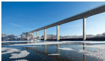
02 Nahezu fugen- und lagerlos: 576,5 m lange Eisenbahnbrücke über das Scherkondetal in Thüringen

Der Deutsche Brückenbaupreis 2012 zeichnet in zwei Kategorien die Leistungen in der Königsdisziplin des Ingenieurbaus aus.