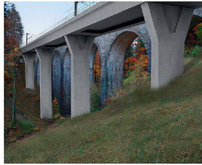
Visualisierung: Ernst Basler + Partner