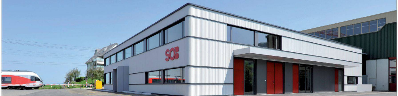
Neubau Betriebsgebäude SOB, Samstagern