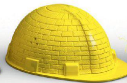
Mauerwerk & Bautelle