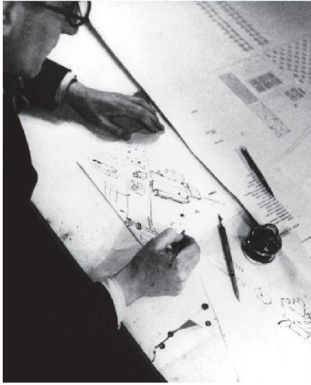
01 Le Corbusier (1887 – 1965) beim Skizzieren, 1935