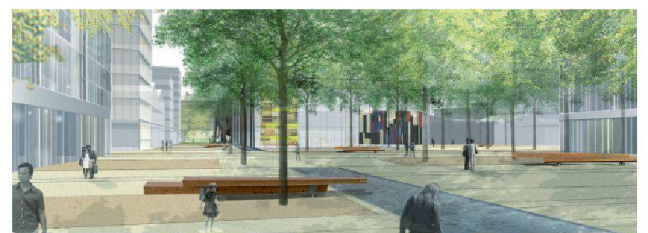
10 Place couverte: vielseitig nutzbare Fläche unter Blätterdach.