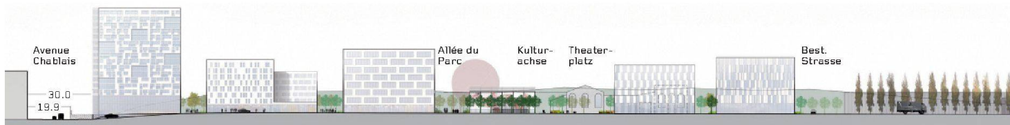
01–02 «Les Coulisses» (SAS Jalbert & Tardivon): Schnitte Ost–West und Nord–Süd, Mst. 1:2300. (Pläne und Visualisierungen: Projektverfasser)

Evolutionärer Kulissenwechsel: Das Team um die Landschaftsarchitekten In Situ Jalbert & Tardivon aus Lyon gewinnt den Wettbewerb für die städtebauliche Entwicklung der öffentlichen Räume an der S-Bahn-Station Prilly-Malley zu einer neuen Mitte für Lausanne West.