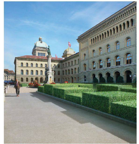
01+02 Siegerprojekt «Zwei schöne Seiten» (4d Landschaftsarchitekten): Situation, Blick auf den Ehrenhof Bundeshaus West mit 36 streng geschnittenen Buchenquadern – jedes Karree ist einem Departement zugeordnet (Pläne + Visualisierungen: Verfasser)

4d Landschaftsarchitekten aus Bern gewinnen den Wettbewerb zur Gestaltung der Umgebung des Bundeshauses in Bern mit einem subtilen Projekt und wenigen Eingriffen.