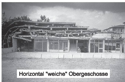
Horizontal "weiche" Obergeschosse