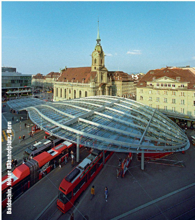
Baldachin, Neuer Bahnhofplatz, Bern

Partner für anspruchsvolle Projekte in Stahl und Glas