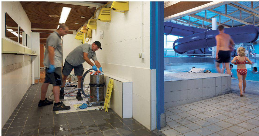
Rohrinnensanierung mit HAT-System: Keine Baustelle. Kein Aufreissen. Kein Bauschutt. Kein Lärm. Also auch keine Betriebsunterbrechungen.

Teure Komplettsanierungen lassen sich umgehen, wenn rechtzeitig eine Zustands- und Machbarkeitsanalyse durchgeführt wird. Eine Analyse des Heizwassers, beispielsweise, liefert mit Hilfe eines mobilen Labors bereits zuverlässige Parameter vor Ort. Mit dem Einsatz einer Wärmebildkamera