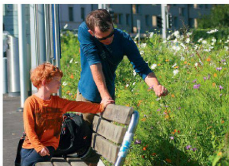
02–03 Schulkinder werden von Gärtnern von Grün Stadt Zürich unterstützt. Botanische Studien an Sommerblumen, die an ungewöhnlichen Stellen in der Stadt ausgesät wurden.

Gespräche sie auslösen. Passanten kommentieren Unterhaltmassnahmen, ein Wort ergibt das nächste, und auf den Flächen beginnen sich gärtnerische und soziale Prozesse zu verflechten.