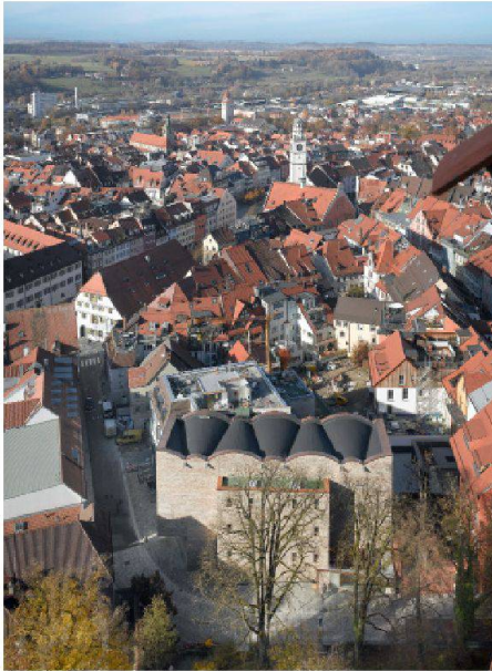
02 Die Fassade aus wiederverwerteten Abbruchziegeln fügt sich in das Bild der Altstadt.