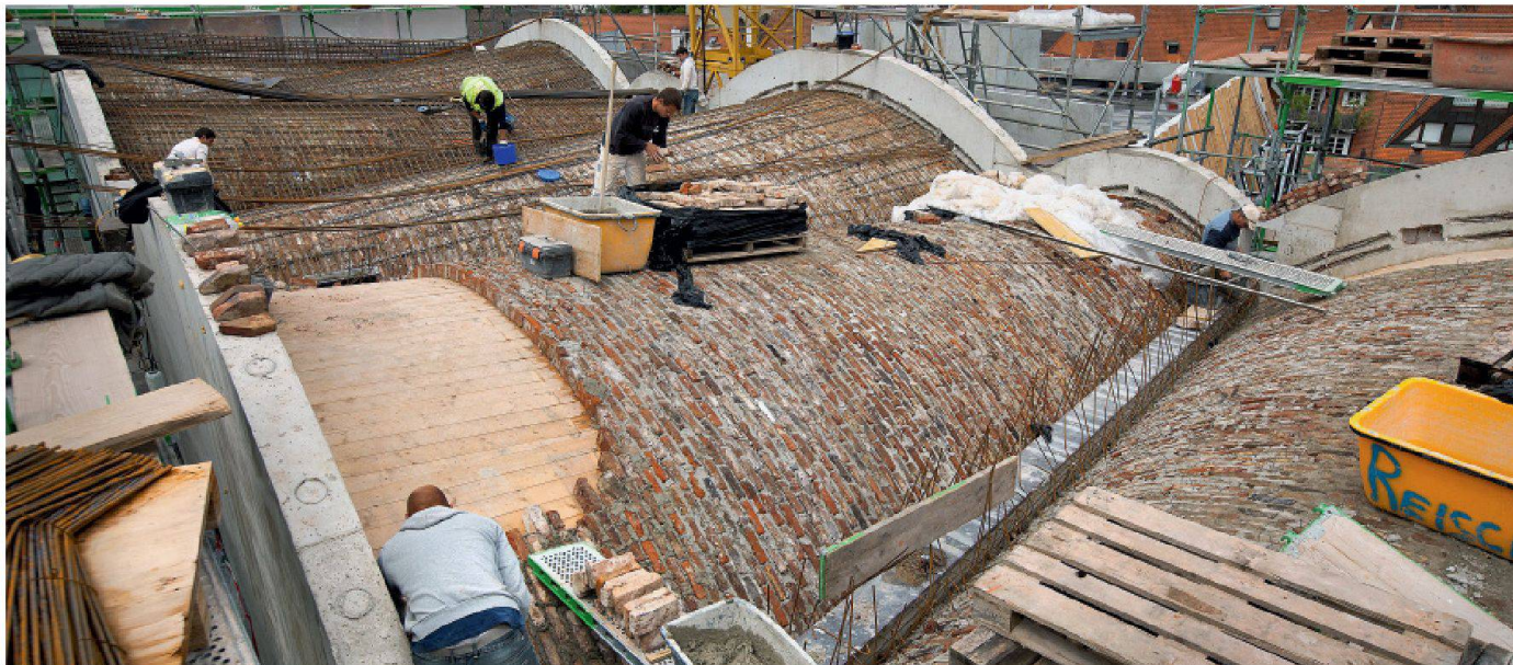
01 Unter der geschwungenen Dachkonstruktion verbirgt sich ein selbsttragendes Tonnengewölbe.

Anfang März wurde im deutschen Ravensburg das neue Kunstmuseum eröffnet. Dabei handelt es sich um das erste Museum weltweit, das nach dem Passivhausstandard zertifiziert ist. Im Buch «Unter schwingenden Gewölben» stellt der Autor Falk Jaeger das Gebäude vor.