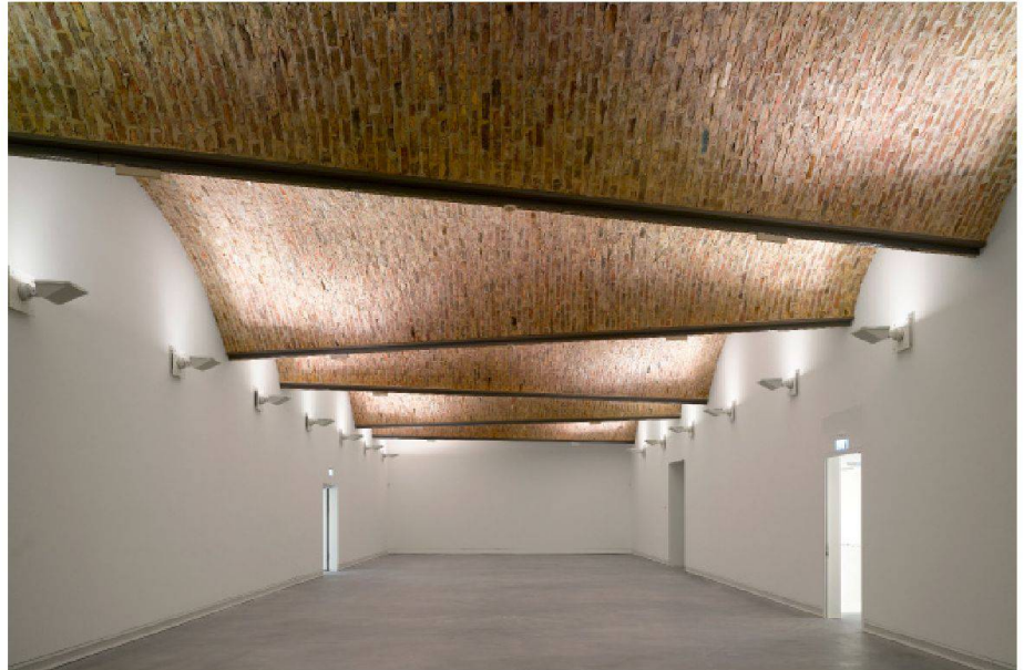
03 Die Konstruktion macht das oberste Stockwerk zu einem beeindruckenden Raum.