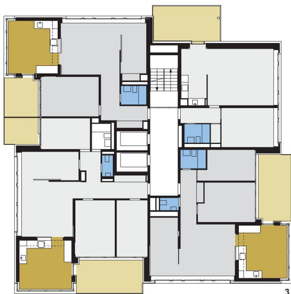
3 Normalgeschoss mit Küchenerweiterungen und neuen Balkonen.

Das Detail zeigt aber dennoch die gestalterische und konstruktive Sorgfalt, die hinter dem neuen Kleid der beiden Häuser steckt. Das Resultat ist eine Fassade, die je nach Lichteinfall und Blickwinkel mit der Umgebung in Verbindung tritt, sich von ihr abgrenzt oder manchmal sogar ganz auflösen scheint. Gleichzeitig ist der horizontal und vertikal strukturierte Charakter der beiden Häuser in rohem Beton hinter der völlig neuen Aussenhaut spürbar geblieben.