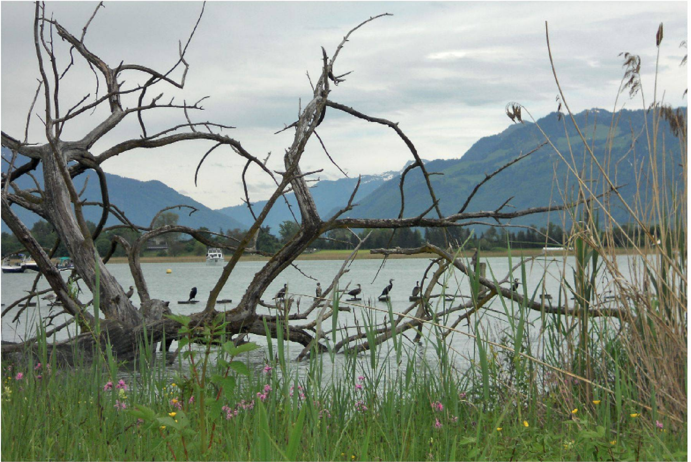
01 Ökologisch wertvolle Uferbereiche auf der Insel Ufenau im Zürichsee. Die Insel gehört zur geschützten Moorlandschaft «Frauenwinkel».

«Einige Kritiker verwechseln die ENHK möglicherweise mit einer Umweltorganisation.»