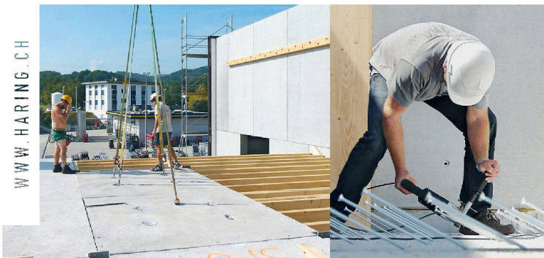
DIE BESTE LÖSUNG IM GESCHOSSDECKENBAU _EINFACH, SCHNELL UND KOSTENEFFIZIENT

Büro Zürich T: 043 311 85 25 Büro Basel T: 061 311 60 60 Büro Bern T: 031 302 95 00 Büro Chur T: 081 252 40 76