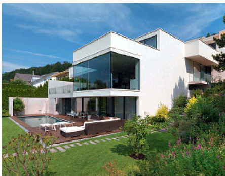
Krapf-Fenster an einem Schweizer Privathaus.

Die chinesischen Investoren entschieden sich für das luftdichte Glasfassadensystem «air-lux» der Krapf AG Metall+Glas aus Engelburg SG. Krapf produziert das selbst