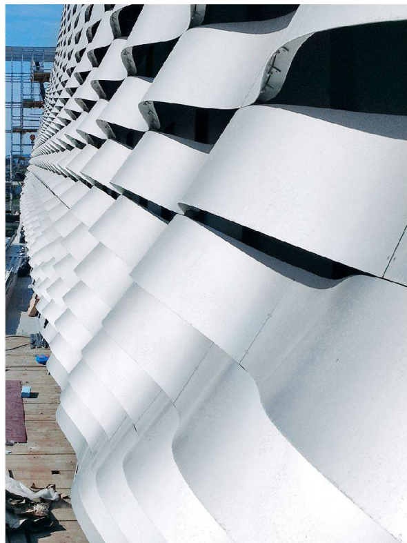
Hinter den locker angeordneten Bändern verbergen sich die 234 voll isolierten Fenster des Baus.

D en Aufwand, den Planer und Unternehmer zur Herstellung von Freiformflächen bei Gebäudefassaden betreiben müssen, ist um ein Vielfaches höher als bei ebenen Flächen und sich wiederholenden Bauelementen. Dazu kommt der grössere Aufwand im Betrieb für Reinigung und Unterhalt. Es bedarf somit handfester Gründe, um solche Konzepte umzusetzen: Beim Neubau der Messe Basel war dafür zum einen der Standort inmitten der Stadt ausschlaggebend, zum anderen spielte die anspruchsvolle Klientel von Ausstellern und Besuchern eine Rolle.