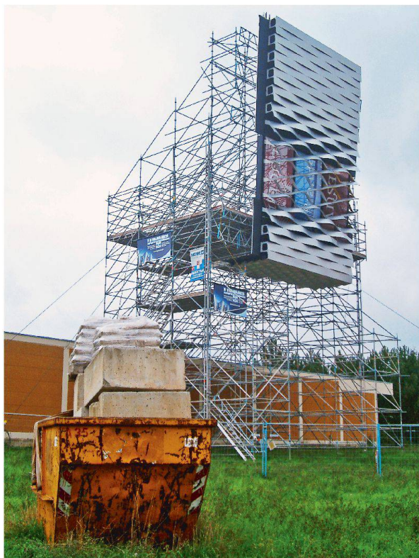
1:1-Modell der Fassade. Die Wölbung der Aluminiumbänder variiert und reguliert die Dichte der Fassade.