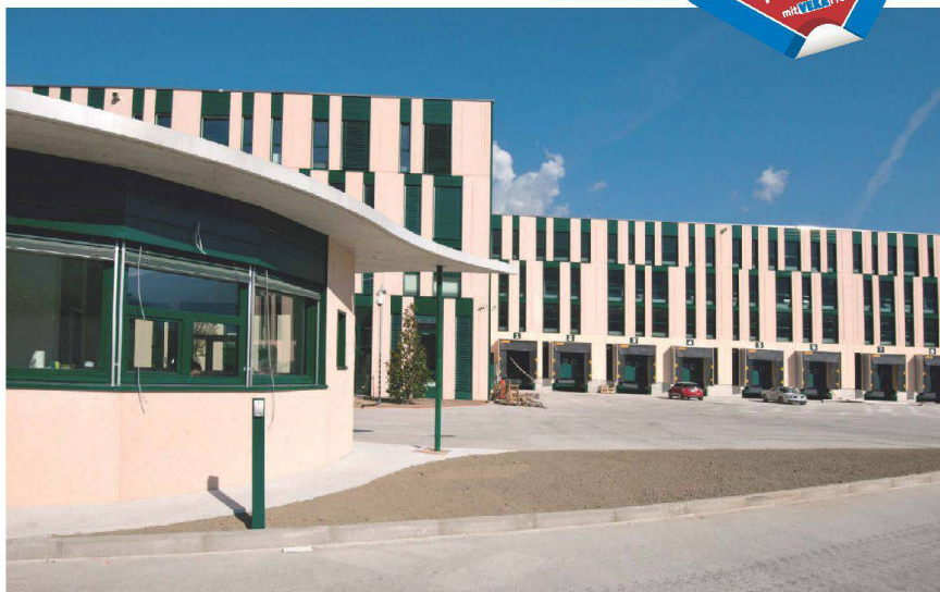
Neues Gucci-Logistikzentrum setzt auf SOFTLINE 82

Vom architektonischen Standpunkt aus betrachtet, war es wichtig, mit dem Fenstersystem sehr schlanke Ansichten realisieren zu können, welche maximalen Lichteinfall in das Innere des Gebäudes erlauben. Zum einen wirkt sich das positiv auf das allgemeine Raumgefühl aus, zum andern steigert Tageslicht das Arbeitswohlbefinden und damit die Produktivität der Mitarbeitenden. Die gewählten, speziell gefertigten schmalen Flügel- und Stulpprofile ermöglichen nun einen Glasanteil am fertigen Fenster von bis zu 77% und sorgen deshalb für angenehmes Tageslicht in den Hallen. Die gewählte Variante swisswindows classico alu mit aussen aufgebrachtener Aluminium-