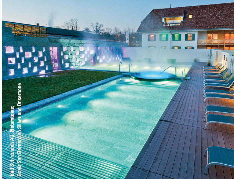
Bad Schinznach AG, Natursteine: Gneis San Bernardino Silber und Onsernone