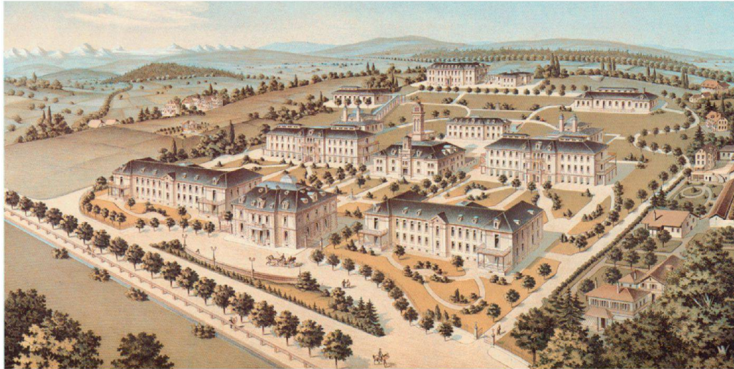
Licht, Luft und Sonne: Das Inselspital Bern im Jahr 1884, umgeben von einem Landschaftspark. Heute liegt das Areal mitten in der Stadt und ist seit vielen Jahren eine Baustelle.

D ie Revision des Krankenversicherungsgesetzes verändert die Spitallandschaft in der Schweiz markant. Weil sich Patientinnen und Patienten heute in jedem Listenspital ihrer Wahl behandeln lassen können, wird für die Zukunft eine deutlich höhere «Patientenmigration» erwartet – so der Fachausdruck. Dazu kommt, dass die künftige Aufenthaltsdauer der Patienten im Spital schwer abschätzbar ist. Die Spitalträger stehen daher vor der schwierigen Entscheidung, auf welche Behandlungs- und Bettenkapazitäten sie sich einstellen sollen.