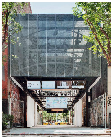
Pavillon BMW Guggenheim Lab aus Carbonträgern (vgl. TEC21 40/2011).