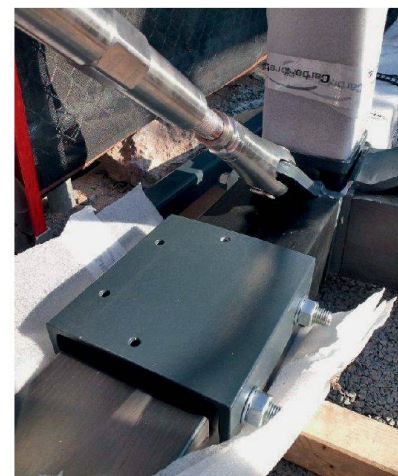
Anschlussdetail der Carbonträger.