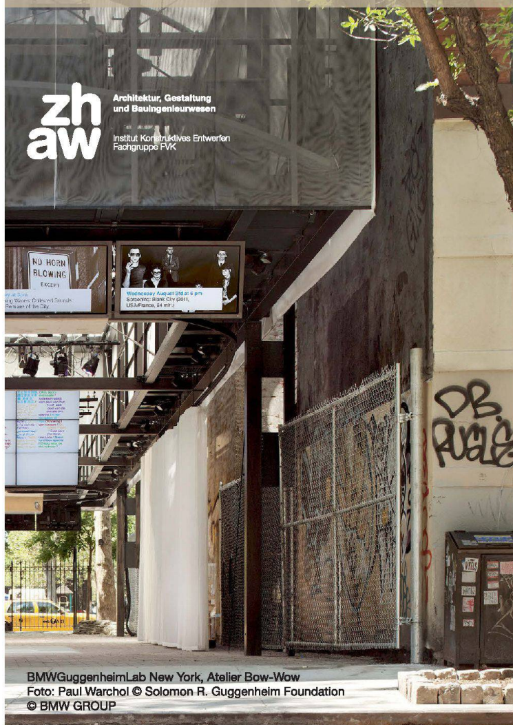
BMW Guggenheim Lab New York, Atelier Bow-Wow

Mittwoch, 26. März 2014 | ZHAW Winterthur