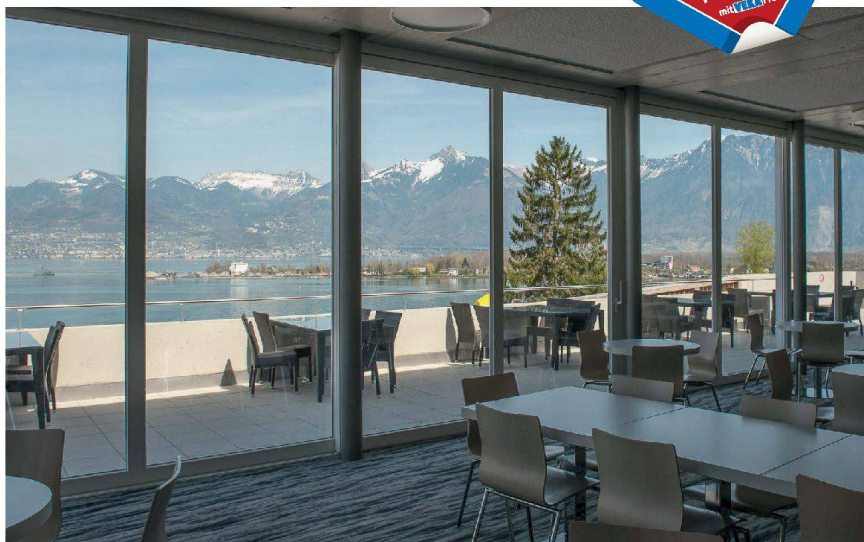
Das neue Schulungs- und Wohngebäude des César Ritz Colleges in Le Bouveret.

In den César Ritz Colleges Switzerland, deren Renommée auf dem Erfolg des innovativen Hoteliers der Luxusklasse César Ritz gründet, werden künftige Spitzenköche und Hotelmanager ausgebildet. Gastfreundlich, grosszügig, funktionell und ein hoher Anspruch an Ästhetik – alles Attribute, nach welchen die Architektur demzufolge verlangte. Ausschlaggebend für die Wahl des Profilsystems SOFTLINE 70 MD waren die umfassenden Systemkomponenten, welche es erlauben, auch grossflächige Fenster entsprechend den Anforderungen auf Mass zu fabrizieren. Ergänzt wurden die mit hochdämmender Wärmeschutzverglasung ausgestatteten Fenster mit dem lückenlos kompatiblen Hebe-Schiebetür-System der Premiumklasse VEKASLIDE. Dieses speziell für grosse Dimensionen entwickelte System überzeugt sowohl mit herausragenden Wärmedämmeigenschaften wie auch mit seinem klassischen Design. Glatte und fugenlose