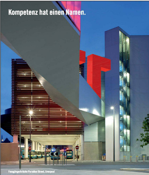
Fussgängerbrücke Paradise Street, Liverpool