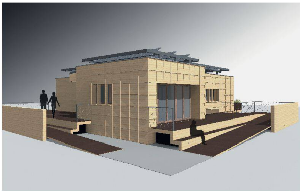
Die naturnahe Hülle aus Holz enthält jede Menge Gebäudetechnik.