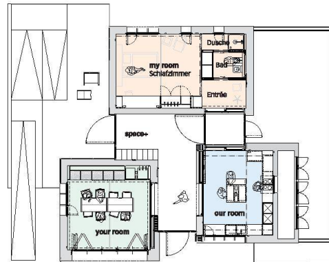
Die vier Raumtypen des Prototyps.