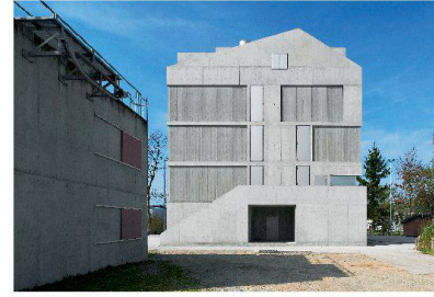
Das Brandhaus II im Ausbildungszentrum Rohwiesen der Zürcher Feuerwehr.

wurde vom SIA mit der «Umsicht»-Auszeichnung 2013 gewürdigt.