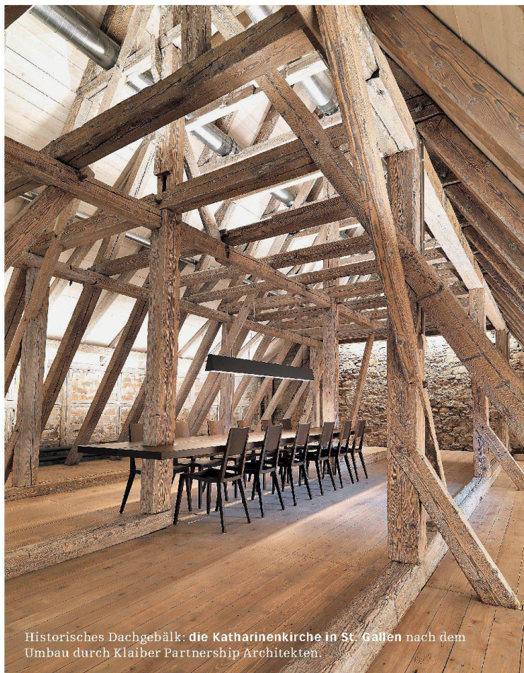
Historisches Dachgebälk: die Katharinenkirche in St. Gallen nach dem Umbau durch Klaiber Partnership Architekten.

D ie SIA-Tage der zeitgenössischen Architektur und Ingenieurbaukunst finden 2014 zum achten Mal statt. Die 2006 unter dem Namen «15n» von der SIA-Sektion Waadt ins Leben gerufene Werkchau hat sich mittlerweile zum wichtigsten Anlass für die publikumswirksame Vermittlung aktuellen Bauens entwickelt. So zog es 2012 mehr als 25000 Besucher zu den 330 neuen Bauwerken von SIA-Fachleuten. In diesem Jahr findet die Werkchau der Architektur- und Ingenieurbaukunst zum zweiten Mal in der