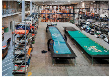
Freitag-Werkstatt im Zürcher Gewerbehause «Nerd» von Beat Rothen Architektur.

In Graubünden steht kein Bauwerk im Fokus, sondern ein Weg – der neu angelegte, neun Kilometer lange Wanderweg «Trutg dil Flem» überwindet 1260 Höhenmeter und verbindet den Ortskern von Flims Dorf mit der Segneshütte. Die Landschaft des schluchtartig eingeschnittenen Flüsschens Flem wird mit zahlreichen kleinen und grossen Brücken erschlossen, die oft zugleich Aussichtspunkte sind. Der unter Federführung des Bauingenieurs Jürg Conzett geplante Weg