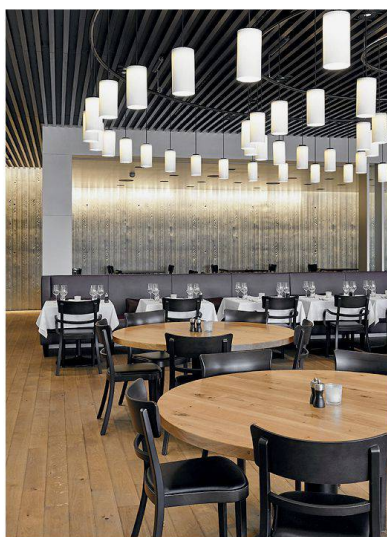
Restaurant «Baulüüt» von scheitlin syfrig Architekten – Campus Sursee in Oberkirch.

SIA-TAGE 2014 am Wochenende vom 9. bis 11. Mai. Alle Objektadressen, Führungstermine und Veranstaltungen der Baukunstschau finden sich auf der dreisprachigen Website www.sia-tage.ch . Dort kann man zudem eine Übersicht der gezeigten Bauwerke gratis als Smartphone-Applikation herunterladen.