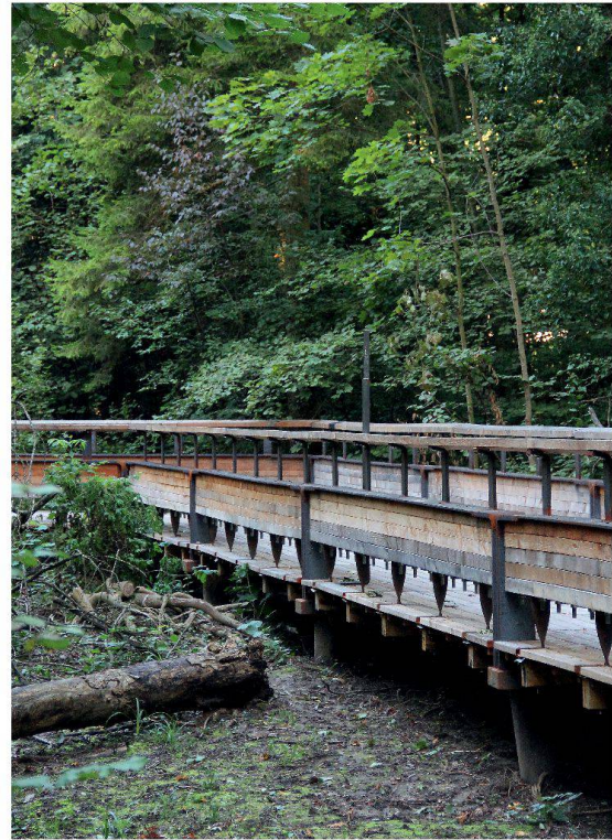
Wie der Baumstamm in der Auenlandschaft verfault auch der Holzsteg – wenn er denn nicht konstruktiv vor Wasser geschützt wird.

Eigentlich, so Kurath, wäre glasfaserverstärkter Kunststoff (GFK) in dieser feuchten und sonnenarmen Umgebung konstruktiv und bezüglich Nachhaltigkeit geeigneter gewesen. Dies zeigt auch eine Ökobilanz, die im Rahmen der EXPO.02 gemacht wurde, relativ deutlich (vgl. «Ökologischer Vergleich», S. 38). Das Erdöl ist bei GFK-Bauten in grossen Bauelementen gebunden, diese sind zwar naturfremd, verrotten aber nicht und haben gerade in dieser Umgebung eine hohe Lebensdauer. Entsprechend einer Kaskadennutzung können sie später weiterverwendet werden und lassen keine Spuren im Wald zurück. Doch dem Menschen, so sinniert Kurath weiter, widerstrebt es optisch und gefühlsmässig, «Plastik» in der Natur zu verwenden. Dies haben auch die Diskussionen im Planungsteam gezeigt. Viele Besucher würden diese Materialien hier nicht schätzen und den Einsatz als falsch empfinden. «Was begreiflich ist», fügt er schliesslich an. Der Mensch soll sich hier wohl fühlen, und der Steg soll den Besuchern Freude bereiten.