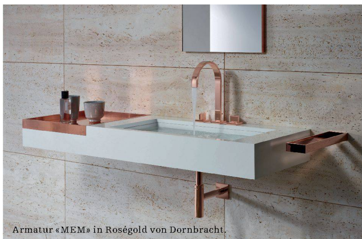
Armatur «MEM» in Roségold von Dornbracht.