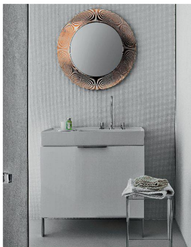
Kollektion von Kartell by Laufen.