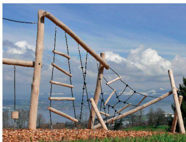
Spielgeräte aus Robinie von Bürli.