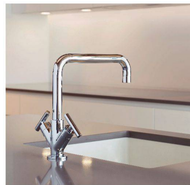
«Arwa Twinprime» von Similor.