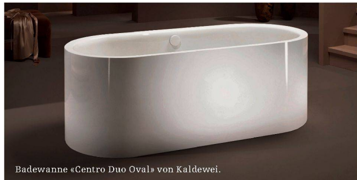
Badewanne «Centro Duo Oval» von Kaldewei.