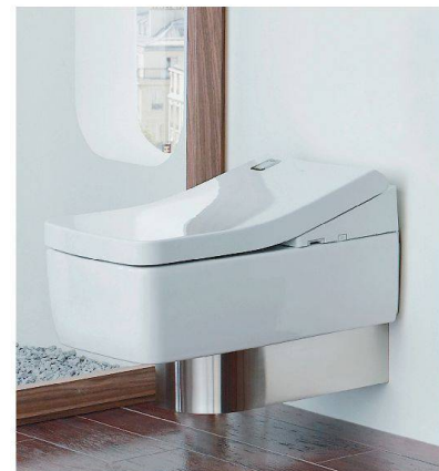
Toilette «Washlet» von Toto.