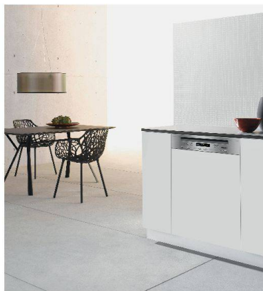
Geschirrspüler «SMS» von Miele.