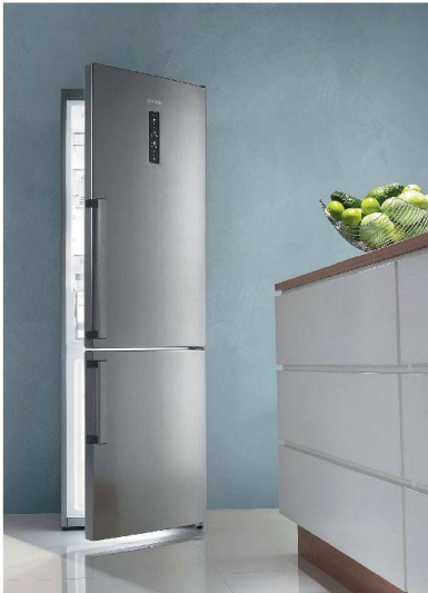
Gorenje NRK von Sibir.