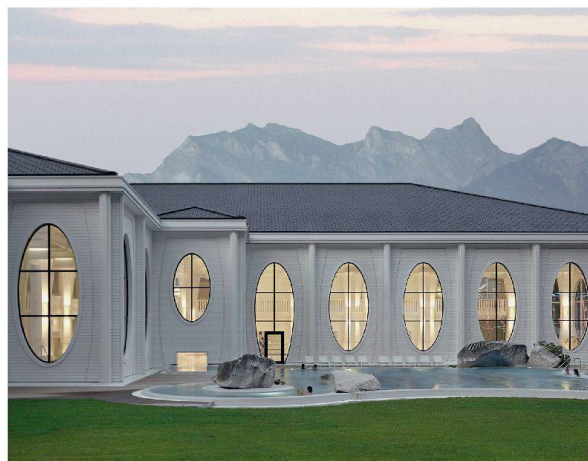
Provoziert: Die Tamina Therme in Bad Ragaz zeigt Haltung und eckt an.

seiner Erneuerung abhanden gekommen, und der Aussenraum sollte nun das leisten, was der Architektur nicht gelang: dem Geviert einen Charakter geben.