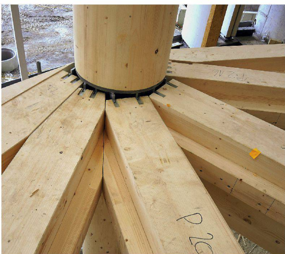
Neue Holzbau AG: Träger an einem Stützenknoten auf der Baustelle der Lodge.