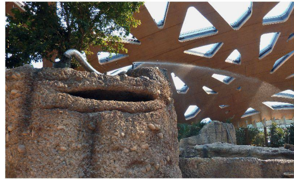
Bewässerung von Ott Aquatec.