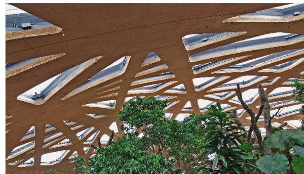
Der Ringbalken aus Beton mit Sika® ViscoCrete® Fließmittel stützt das 1500 t schwere Holzdach.