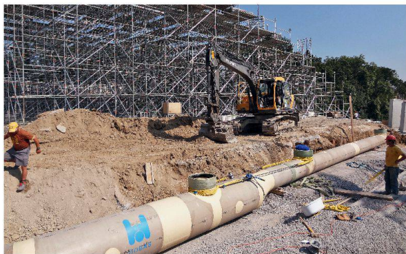
Verlegung der Lüftungsröhren von Hobas.