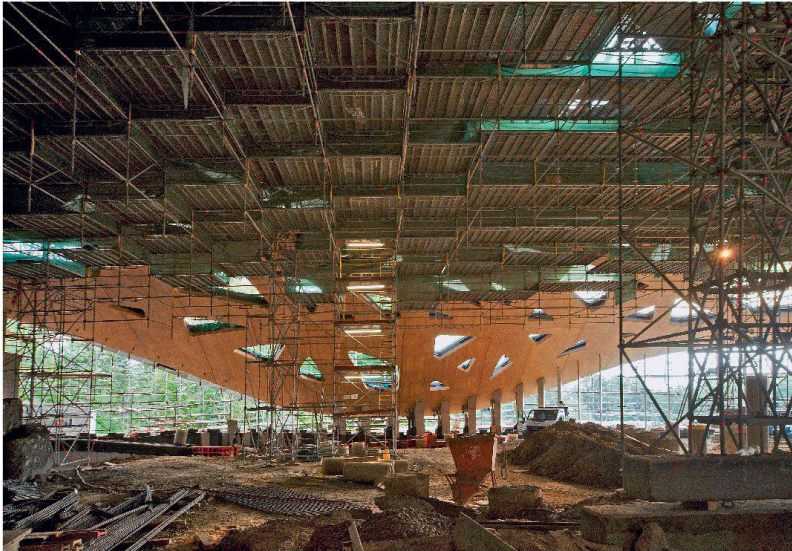
Das Lehrgerüst wurde nach der Entlastung umgebaut und als Flächengerüst am Dach aufgehängt.