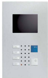
VTC40 / Alu

Video-Innensprechstellen aus edlem Metall – bilden einen Blickfang im gehobenen Innenausbau. Als Klein-ausführung im Schalterformat (Gr. 1+1) oder mit grösserem Farbdisplay für erweiterte Videoüberwachung. Die Frontplatten aus veredeltem Aluminium bestechen durch das klare Design und bleiben zeitlos wertbeständig. Die neueste Technik ermöglicht überall einen schlanken Einbau.