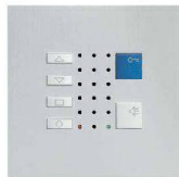
TC40 / Alu