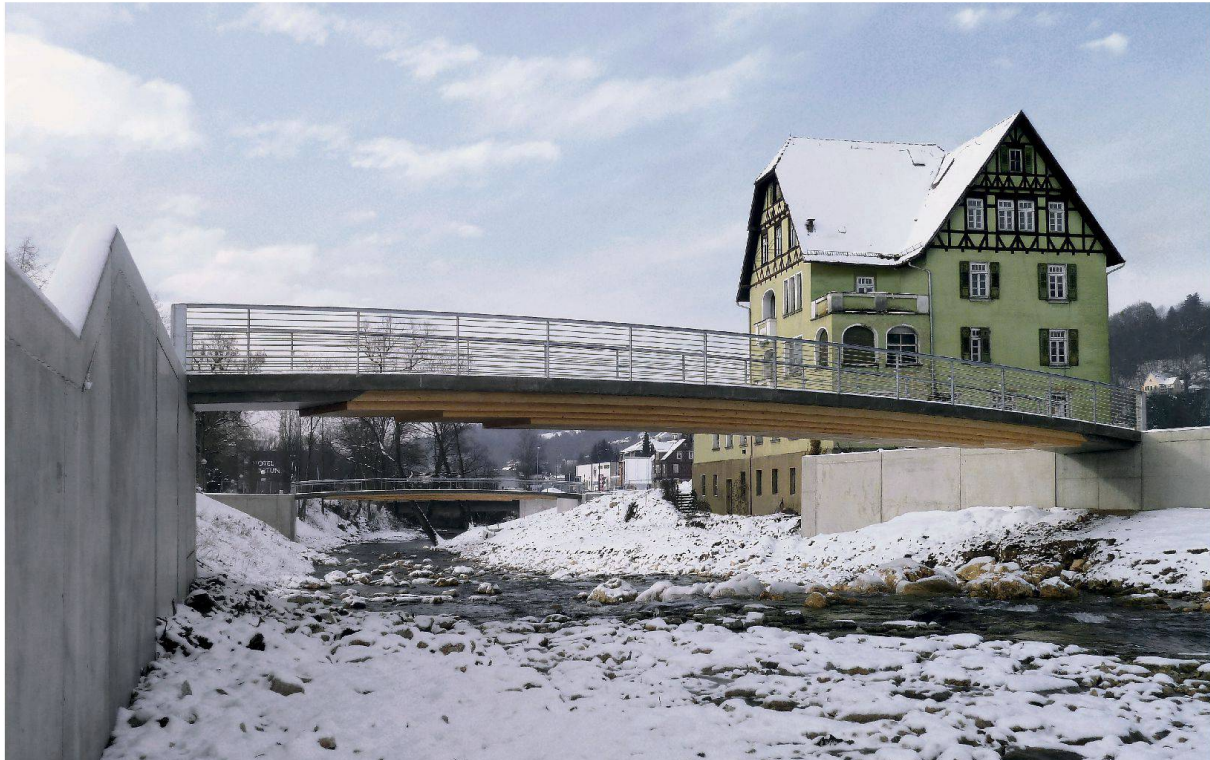
Das Rahmentragwerk aus Holz und Beton in integraler Bauweise führt die Tradition der Holzverbundbauweise innovativ weiter.

In Schwäbisch Gmünd (Baden-Württemberg) findet dieses Jahr die Landesgartenschau 2014 1 statt. Die Planung der verantwortlichen Landschaftsarchitekten A24 aus Berlin umfasst unter anderem zwei neue Brücken über die Rems. Diese Bauwerke sind Anfang 2013 als innovative, 26 und 28 m lange Fussgänger- und Radwegbrücken in HBV-Bauweise fertiggestellt worden (Abb. oben). Sie wurden erstmalig als integrale Bauwerke ohne Fugen und Lager konzipiert. Durch die integrale Bauweise stellt sich ein spezifischer Beanspruchungszustand ein, auf den die Architektur