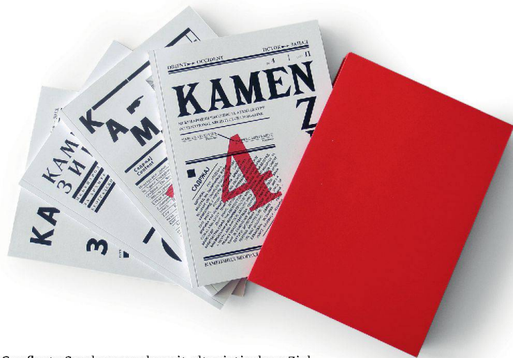
Gepflegte Sonderausgabe mit altruistischem Ziel.

M it ihrer Zeitschrift «Camenzind» regen BHSF Architekten aus Zürich den Diskurs über Architektur an – nicht nur in der Schweiz. Seit 2005 erscheint das Heft in unregelmässigen Abständen und ist meistens in einem wilden und ungewöhnlichen Layout gehalten.