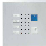
TC40 / Alu

René Koch AG 8804 Au/Wädenswil 044 782 6000 info@kochag.ch www.kochag.ch