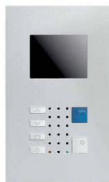
VTC40 / Alu