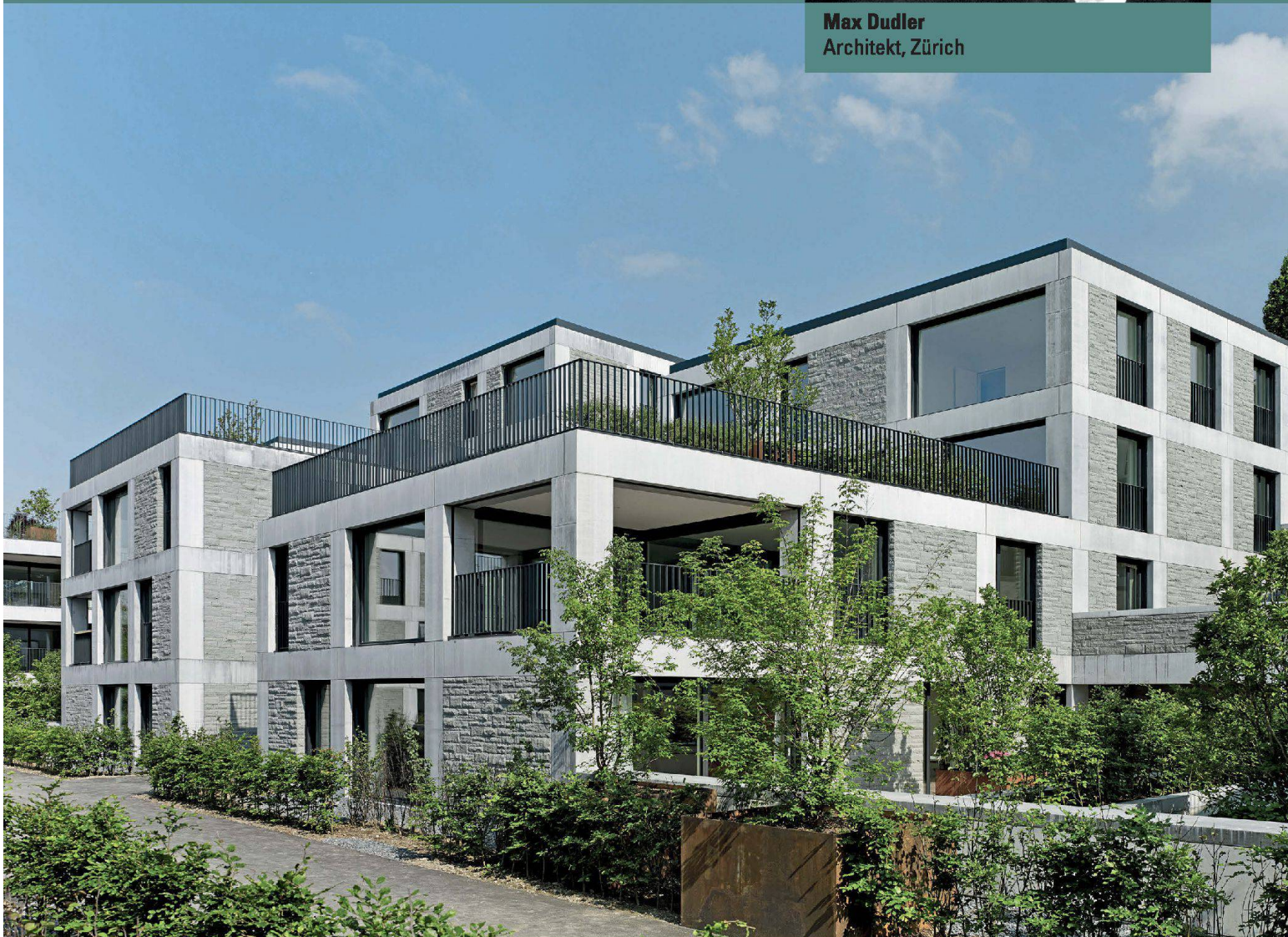
Max Dudler Architekt, Zürich