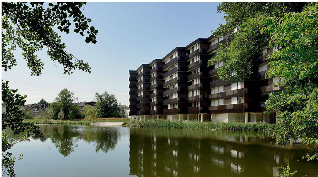
Nicht nur der Wohnbau von Morger Dettli Architekten steht dicht am Herterweiher, sondern auch der sich im Bau befindliche Wohnbau von Herzog & de Meuron auf dem gegenüberliegenden Ufer.

N ach dem Wakkerpreis 2001 verlieh der Schweizer Heimatschutz der Stadt Uster in diesem Jahr auch den Schulthess Gartenpreis. Ausgezeichnet wurden vor allem die qualitätvolle und kontinuierliche Freiraumgestaltung um den Aabach und der Umgang mit der historischen Bau- und Gartensubstanz. Der Gartenpreis ist eine logische Konsequenz des Wakkerpreises – so die Fachkommission, die für die Verleihung beider Preise zuständig ist: Architektur, Gartengestaltung, Landschaftsarchitektur und denkmalpflegerische Aspekte ergänzen sich in Uster zu hoher nutzerischer Qualität.