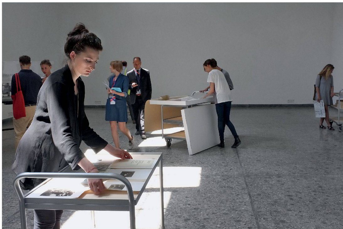
Studierende der ETH Zürich präsentieren Faksimile aus den Archiven von Cedric Price und Lucius Burckhardt . Die Archivmöbel stammen von Herzog & de Meuron.

Der Engländer Cedric Price (1934–2003) war, obwohl er kaum etwas gebaut hat, einer der einflussreichsten Architekten der zweiten Hälfte des 20. Jahrhunderts. Mit seiner Lehrtätigkeit an der Architectural Association School of Architecture (AA) in London und seinen visionären Projekten formte er eine ganze Generation von Architektinnen und Architekten, die den strengen Modernismus der 1950er-Jahre neu definieren wollten. Seine überraschenden Projekte – die Universität auf Schienen, das Kulturzentrum als Bausatz – regen zu einer Architektur der Bewegung und Entwicklung an. Der Schweizer Lucius Burckhardt (1925–2003) war ein Spaziergänger. Der Soziologe und Städtebautheoretiker