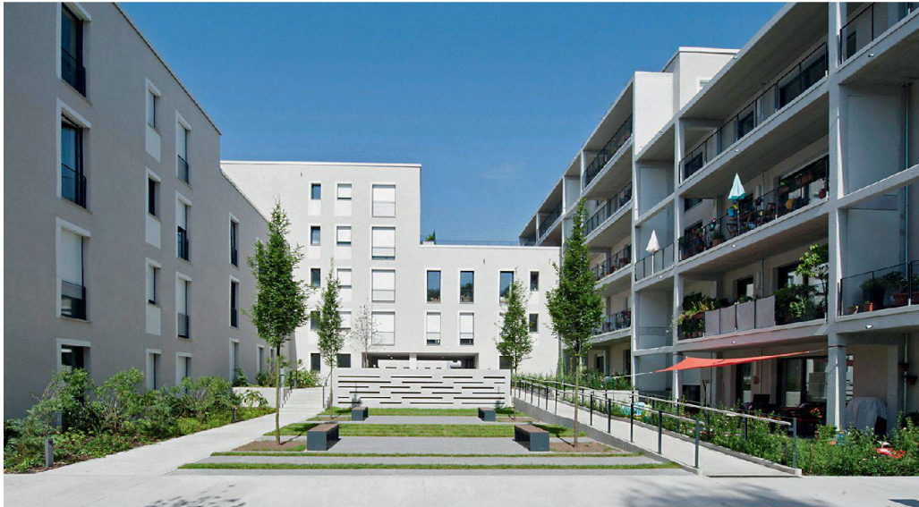
Die ABG Frankfurt Holding hat in der Metropole Frankfurt und im Rhein-Main-Gebiet bereits über 2500 Mehrfamilienhäuser im Passivhausstandard gebaut.