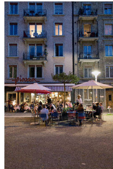
Die Bewohner am Idaplatz sind dem regen Nachtleben im verkehrsberuhigten Quartier ausgesetzt.

Es werde immer sofort aufgeräumt, wurde in der anschliessenden Diskussion festgestellt. Das «Einfach-weniger-Aufräumen» erschien als die einfachste Massnahme gegen das Unbehagen angesichts von Zürichs unheimlich perfektem Stadtraum. Schwieriger zu beantworten war die Frage, wie weit das Bedürfnis nach Sicherheit die Nutzungskonzepte dirigieren dürfe. Walter Angst hinterlegte seine These der Homogenisierung und Ausgrenzung mit Untersuchungen, Verordnungen und Medienberichten. Die Studie des Zentrums Öffentlicher Raum des Schweizerischen Städteverbandes stellt unter anderem fest, dass bestehende Plätze teilweise anders genutzt werden als geplant – trotz Veranstaltungskonzepten, Quartierverträglichkeitsüberlegungen und Mitwirkungsverfahren durch die Stadtverwaltung. Diese Perspektive relativiert die Macht der amtlichen Regulierung. Andere Beobachtungen allerdings sind beunruhigender, wie die zunehmende Vernetzung von Informationen über Instrumente wie den GeoIndex (von der Zürcher Stadtpolizei am Schweizer Polizei Informatik Kongress 2013 vorgestellt) und das von der Polizei in Dubai eingesetzte Google Glass, das gesuchte Fahrzeuge oder Personen elektronisch identifiziert.