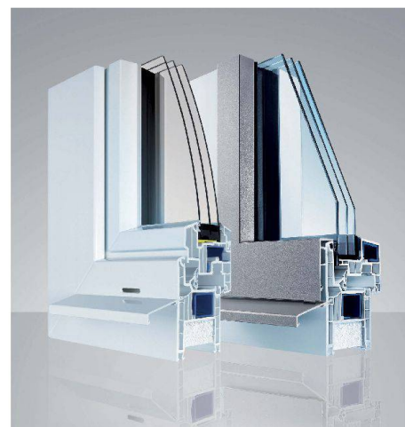
EgoKiefer Kunststoff- und Kunststoff/Aluminium-Fenster AS1®

Für weitere Ausführungen jetzt Unterlagen bestellen und CAD-Vorlagen für Ihre Planung downloaden unter www.egokiefer.ch .