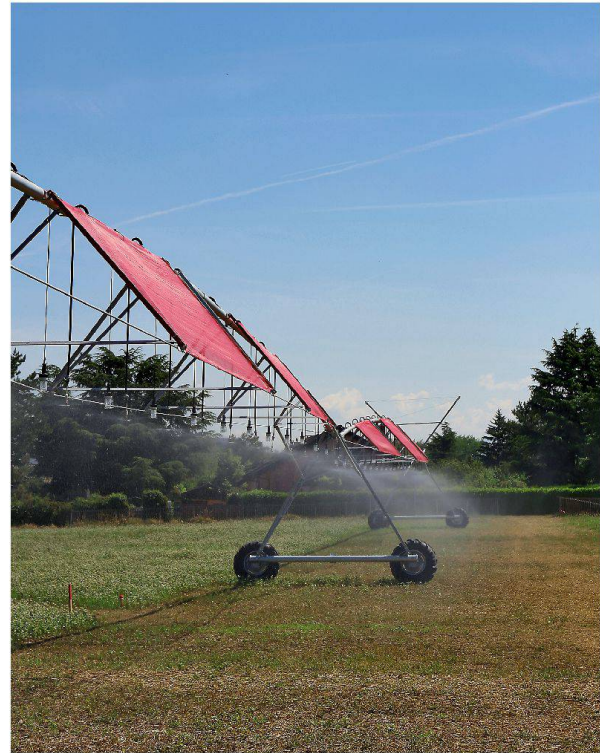
Schatten, Licht und Wasser für die Ackerblumen und für eine schönere Landwirtschaft: Sous le grand portique .

Der Weg führt weiter zu einer anderen typischen Stadtrandssituation, zu Schuppen und Lagerplätzen kleiner Bauunternehmen. Hier wird am Samstagmorgen geschweisst und gehämmert. In dieser profanen Um-