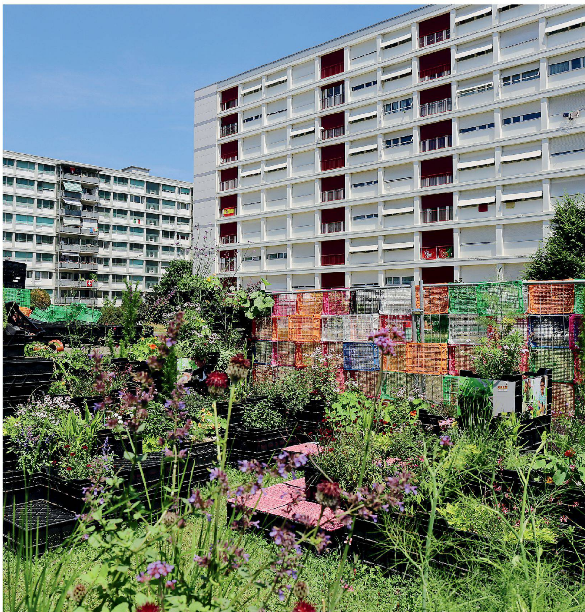
Label Cité: Eine neue Aufgabe für den Stadtraum der Moderne postuliert diese bunt bepflanzte Harassenburg in Onex Cité bei Genf.