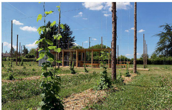
Trinken und lernen auf dem Champ de bière .