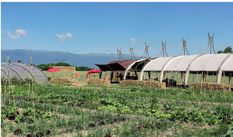
Im Feldrestaurant in Bernex wird gegessen und getrunken, was die Region hergibt.