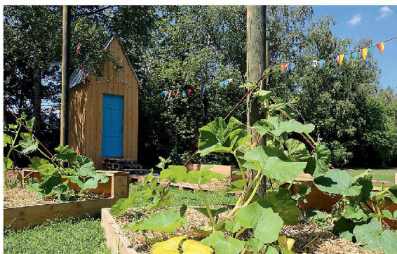
Göttlicher Kreislauf im Jardin digestif .

Ackerblumen vertilgt, die Arbeit mit den Händen und Nutztieren verdrängt, sodass manchenorts nur geometrisch geordnete Monokulturen geblieben sind. Doch, vermutlich ist eine Reästhetisierung der Nahrungsproduktion nötig.